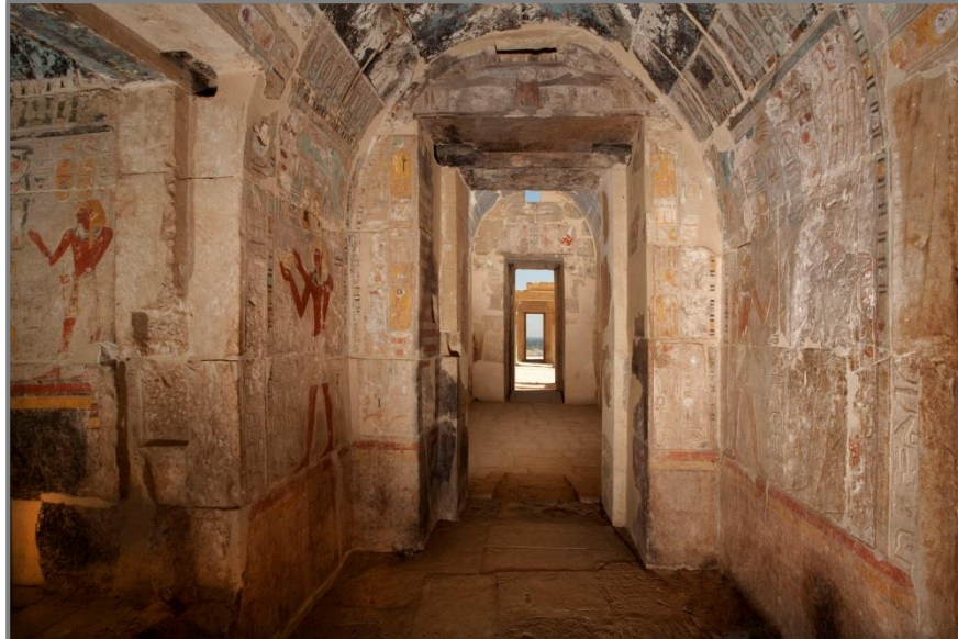
Widok pomieszczeń Sanktuarium Amona-Re po zakończeniu prac.

Kolejna część świątyni Hatszepsut w Deir el-Bahari zostanie udostępniona dla zwiedzających. Uroczyste otwarcie Głównego Sanktuarium Amona-Re oraz poprzedzającego go Portyku Ptolemejskiego zostało zaplanowane na 9. grudnia 2017 r. na godz. 14:00.