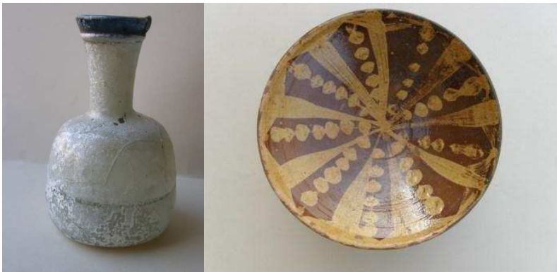
Fot. 3 Szklana butla i glazurowana misa znalezione w grobach

celów wykorzystywano także opuszczone budowle „J” i „AA”. W tym roku odsłonięto 43 pochówki pochodzące najprawdopodobniej z XII i XIII wieku n.e. Ta część cmentarza z kilkoma dobrze zachowanymi prostokątnymi nagrobkami została niestety poważnie zniszczona przez stojącą wodę, co spowodowało całkowitą destrukcję mat okrywających trumny, samych drewnianych trumien, cennych tkanin pogrzebowych (całunów) oraz szat osób zmarłych. Na szczęście zachowały się szkielety, biżuteria oraz naczynia szklane i glazurowane wkładane zmarłym do trumien, które będą przedmiotem dalszych studiów.