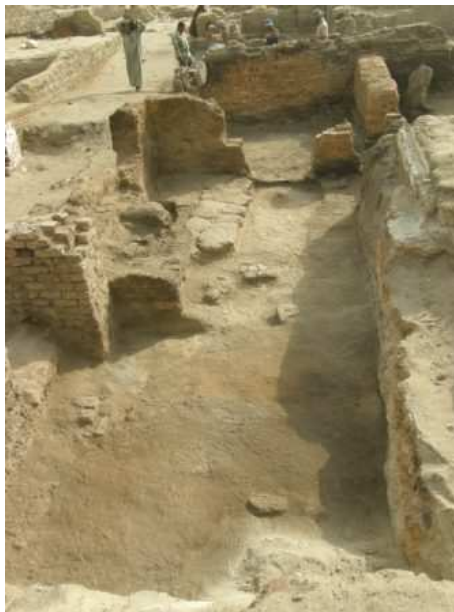
Fot. 1 „Budowla J” – widok od zachodu na pozostałości budowli