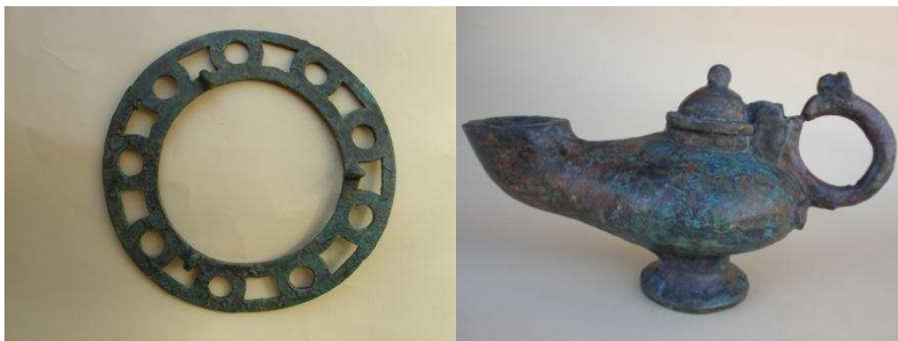
Fot. 2 Polikandylion i lampa z brązu po konserwacji

również brązowe lustro ścienne oraz okucia dużej szkatuły. Te cenne przedmioty wskazują, że mieszkaniec tej części budynku musiał pełnić ważną funkcję w klasztorze. Potwierdza to także znalezisko zespołu dinarów abbasydzkich i aghlabidów północno afrykańskich, odkrytych w 2009 roku – obecnie oczyszczonych i poddanych dalszym badaniom.